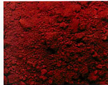
B.1017 - Rosso Ossido Ferro Sintetico Scuro