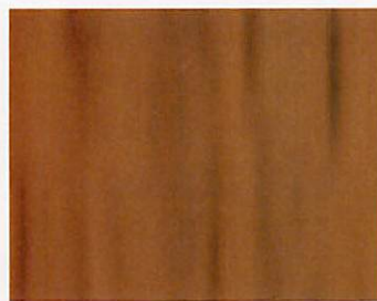
B.8218 - Mordente Noce