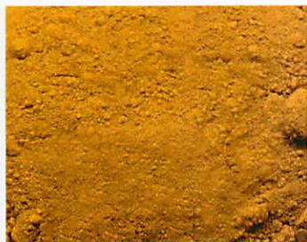
B.1040 - Giallo Ossido Ferro Sintetico