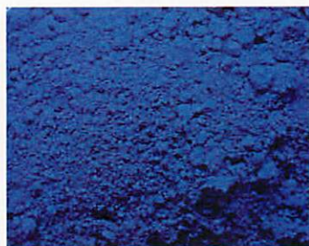
B.817 - Bleu Oltremare