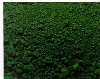
B.812 - Verde Ossido Cromo