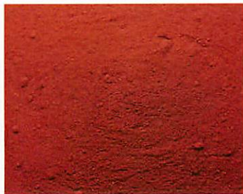
B.9450 - Rosso Ossido Ferro Sintetico Chiaro