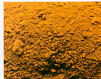
B.667 - Giallo Ossido Ferro Fiore