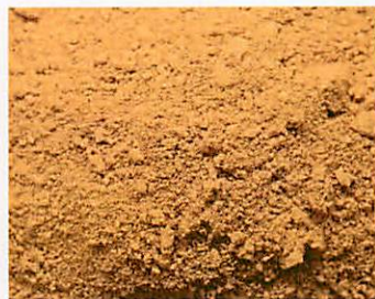
B.JOLES - Ocra Gialla Dorata