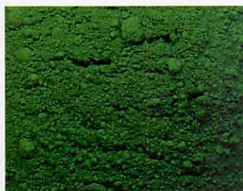
B.8005 - Verde Pigmento