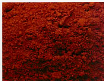
B.5876 - Siena Rossa Bruciata