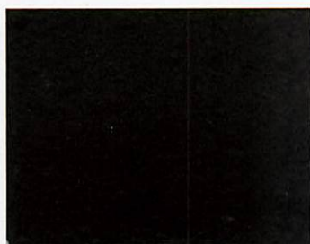
B.9313 - Nero Ossido Ferro Sintetico