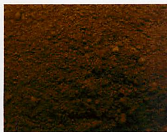
B.0BA - Ombra Bruciata