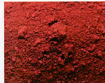
B.10A - Rossetto Inglese