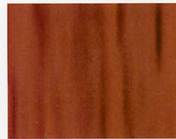
B.8219 - Mordente Mogano

I colori indicati sono quanto di più vicino ai colori reali che le moderne tecniche di stampa permettono di ottenere. Una piccola variazione è tuttavia possibile.